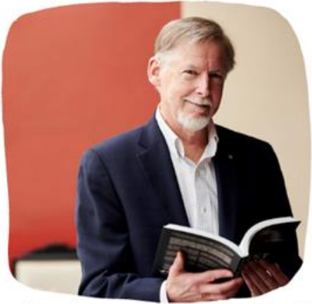
Професор бізнес-школи IMD Філ Розенцвейг