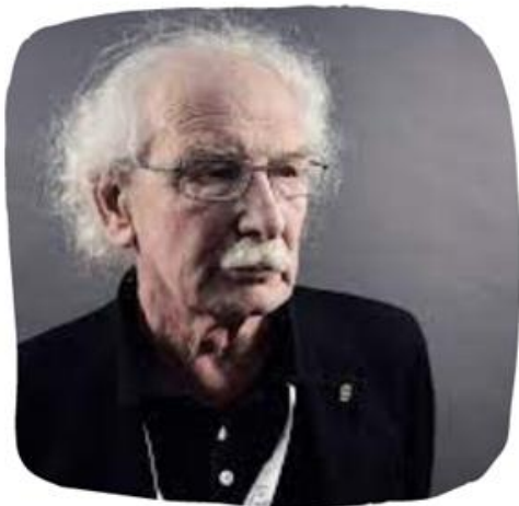
Італійський нейрофізіолог Дж'акомо Ріццол'атті