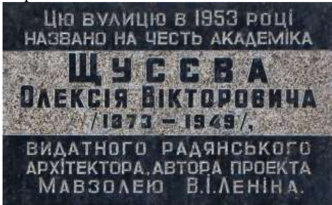
Колишня анотаційна дошка

Пролягає від вул. Олени Теліги до залізничного шляхопроводу і вул. Стеценка. Становить частину автомагістралі Київ - Ковель - Брест. Виникла в серед. ХХ ст. під назвою вул. Нова 881-а. Сучасна назва на честь Олексія Вікторовича Щусєва - з 1953 (повторна постанова про найменування - 1955). У деяких джерелах фігурує як вул. Академіка Щусєва. До цієї вулиці прилучаються: вулиці Грекова - М. Берлинського - пров. Орловський - вул. Вавилових - Житкова - Орловська - пров. Щусєва і вул. Тираспольська.